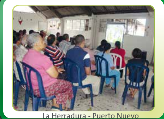
La Herradura - Puerto Nuevo

En el proceso de socialización del Interceptor norte, para la zona de influencia en Medellín, realizamos ocho (8) reuniones informativas, todas con la participación decidida de la comunidad de los barrios y sectores de Caribe, La Herradura, Puerto Nuevo, Sinaí, Palermo, Villa Niza, Andalucía, El Playón, La Frontera, La Paralela y Playitas. También en el municipio de Bello realizamos la socialización el 25 de enero de 2012 con las empresas y entidades ubicadas en las zonas de influencia.