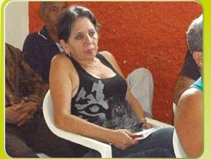
Lider de la Junta de Acción Comunal (JAC) (Barrio zamora)

Este taller de educación ambiental estuvo espectacular porque esto nunca lo habíamos visto nosotros, para mí fue una sorpresa, de igual manera para la gente líder que yo invité fue una sorpresa, porque ellos no esperaban este tipo de taller".