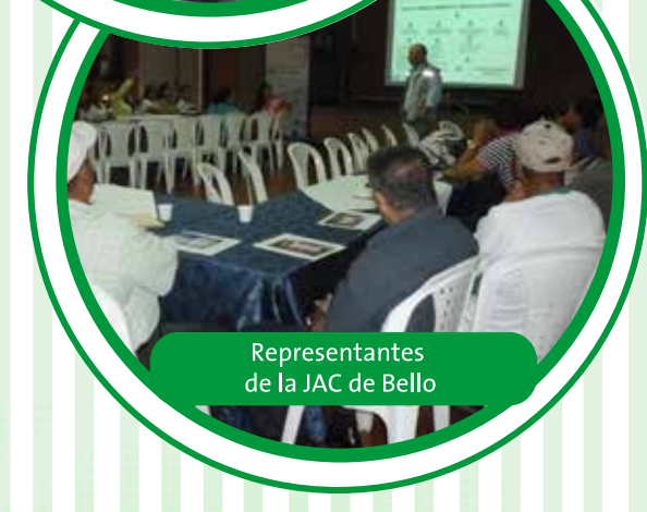
Representantes de la JAC de Bello