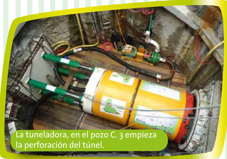
La tuneladora, en el pozo C. 3 empieza la perforación del túnel.

Durante la instalación de los tubos se aplican todas las medidas de seguridad para garantizar la calidad y permanencia del túnel para su funcionamiento.