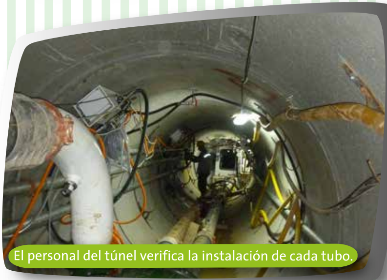
El personal del túnel verifica la instalación de cada tubo.