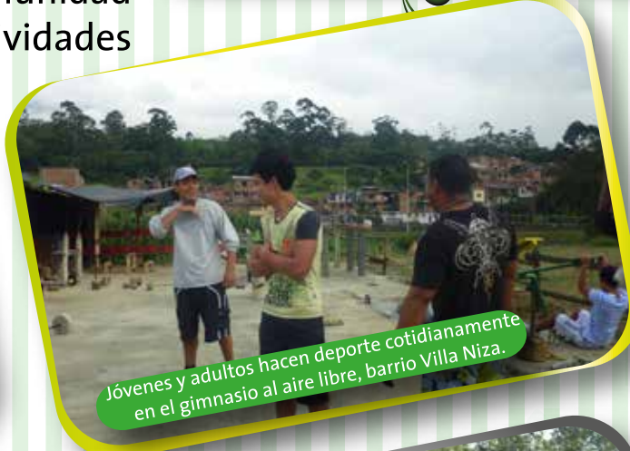
Jóvenes y adultos hacen deporte cotidianamente en el gimnasio al aire libre, barrio Villa Niza.