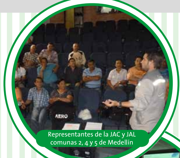
Representantes de la JAC y JAL comunas 2, 4 y 5 de Medellín

Todos los asistentes valoraron los beneficios que traerá el Interceptor Norte y manifestaron su interés en seguir participando en las diferentes actividades.