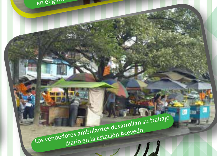
Los vendedores ambulantes desarrollan su trabajo diario en la Estación Acevedo.