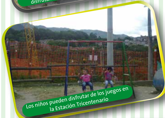
Los niños pueden disfrutar de los juegos en la Estación Tricentenario.