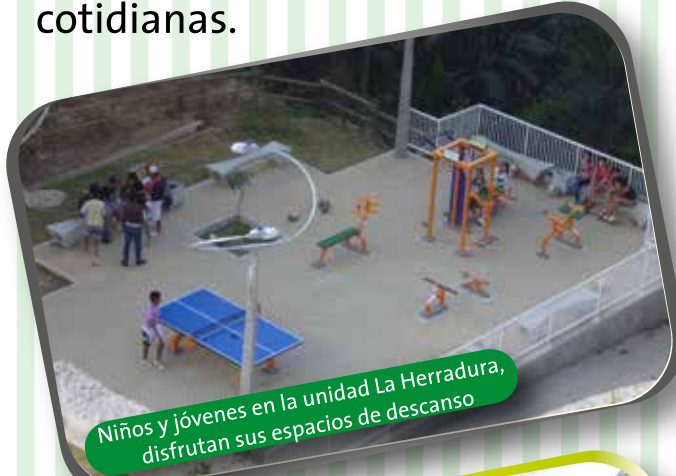
Niños y jóvenes en la unidad La Herradura, disfrutan sus espacios de descanso.

Mientras el Interceptor Norte del río Medellín avanza bajo la tierra, la comunidad en la superficie, sigue con sus actividades cotidianas.