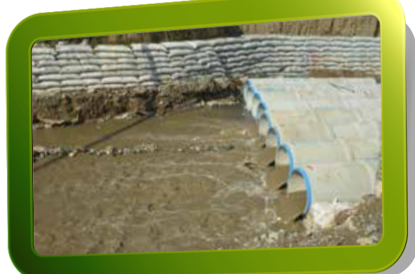
► Margen derecha de la quebrada.