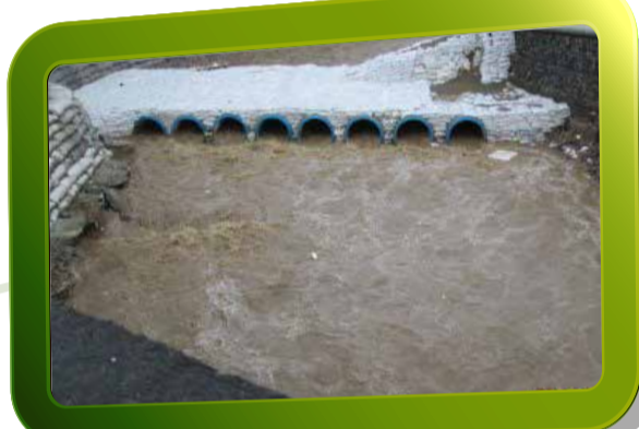
► Desvío de la quebrada a través de alcantarillas