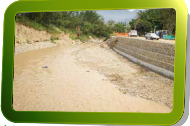
► Margen izquierda de la quebrada.

Uno de los fines en el desarrollo del proceso constructivo del Interceptor Norte, desde el Plan de Gestión Ambiental, es el cuidado y protección a las fuentes de agua y las quebradas, ubicadas a lo largo del proyecto. En el último periodo se han desarrollado obras de protección y contención a la quebrada La García, que desemboca al río Medellín donde se ubica el pozo 20, cercano al Coliseo Polideportivo Tulio Ospina en Bello. Con estas obras se brinda mayor seguridad y estabilidad a la quebrada y al Interceptor.