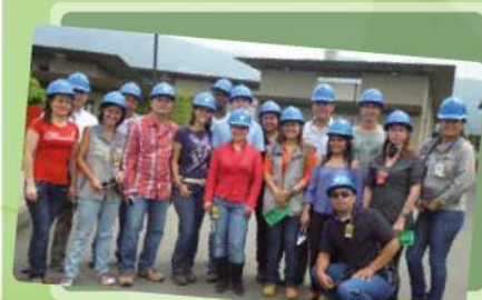
Persona de CICE en Planta San Fernando

"Esta visita me pareció una buena forma de concientizar como contaminamos las aguas y la forma como se puedan recuperar y mejorar la calidad de vida de las personas que viven alrededor del río porque las aguas se están limpiando, se pueden mejorar los sectores. Toda esta información son cosas que uno aprende, y no sabía como se llevaba este proceso del tratamiento de las aguas, esto se le puede transmitir a los muchachos y se les puede generar esa conciencia del cuidado del agua."