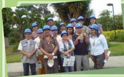
La comunidad de La Gabriela visita la Planta San Fernando