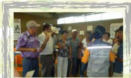
Participantes de la Paralela y Playitas comuna 5