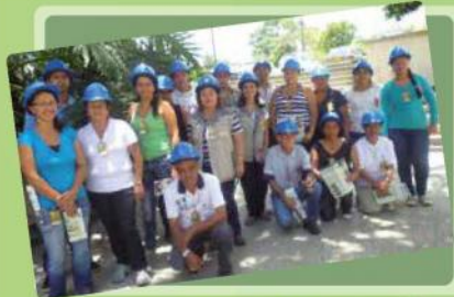
Fontidueño, Las Vegas y Ciruelos en Planta San Fernando

Cada uno de los asistentes estuvieron atentos a los recorridos y explicación de los procesos que se desarrollan en la Planta para el tratamiento de las aguas residuales. Dicha visita cumple el objetivo de mostrar a la comunidad en forma directa, una parte del programa de saneamiento del río Medellín.