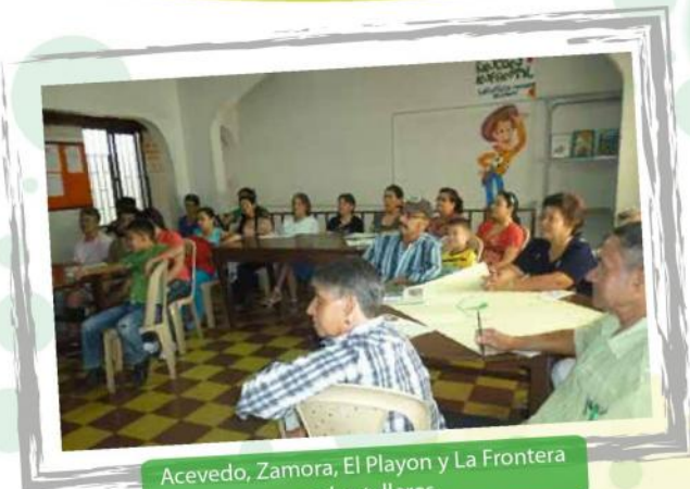
Acevedo, Zamora, El Playon y La Frontera en los talleres