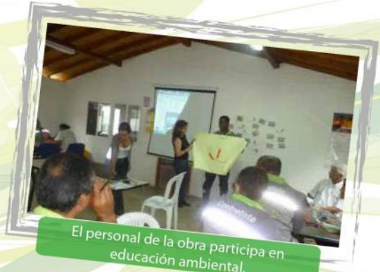
El personal de la obra participa en educación ambiental.