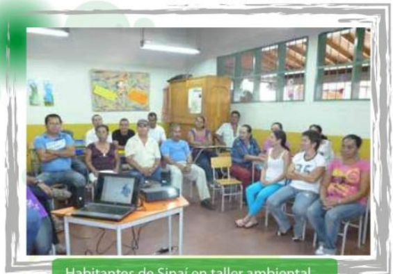
Habitantes de Sinái en taller ambiental