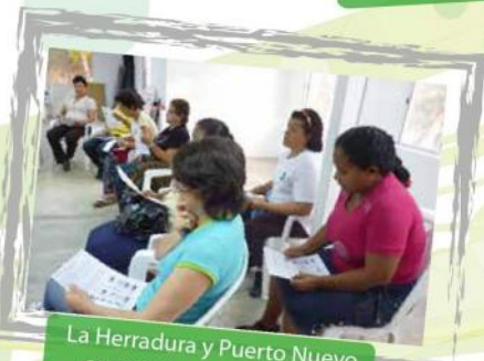
La Herradura y Puerto Nuevo constantes en los talleres