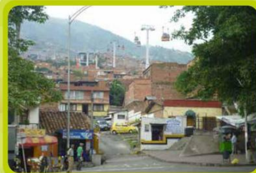
Andalucía parte alta.

Han respondido muy bien, de mente muy abierta para recibir los conceptos y las recomendaciones, también han sido muy inquietos para plantear preguntas, se han acogido bien sobre todo al primer componente que es el pedagógico, han sabido interpretar la norma, hacer uso de la herramienta pedagógica para no infringir la norma y evitar los procesos sancionatorios. Hace algunos años los barrios estaban llenos de escombros, de basuras y elementos físicos que daban un impacto negativo y yo creo que el indicador más grande es ver hoy unos barrios limpios y sanos.