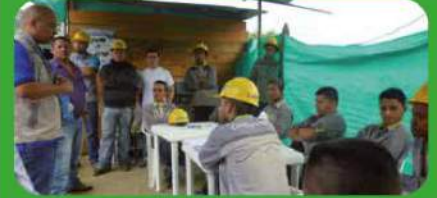
El personal del pozo 6 se capacita en el Plan de manejo ambiental.