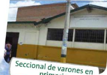
Seccional de varones en primaria