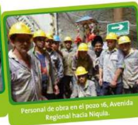
Personal de obra en el pozo 16, Avenida Regional hacia Niquia.