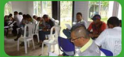
El personal del obra se capacita periódicamente.