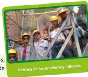
Patrona de los tuneleros y mineros.

En el año 235 D.C su padre regresó del viaje, vio la reestructuración de la torre y preguntó a los obreros: "Por qué habéis hecho tres ventanas?, y ellos contestaron: "Porque su hija lo ordenó". Ante esto Dióscoro mandó a llamar a Bárbara para conseguir una respuesta sobre la tres ventanas, le hizo la misma pregunta y ella respondió: "Mandé a hacer una ventana más para que fueran tres, porque tres ventanas dan luz a todo el mundo y a todas las criaturas, mientras que dos ensombrecen el Universo. Esas tres ventanas representan claramente al Padre, al Hijo y al Espíritu Santo".