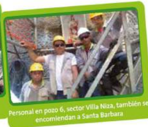
Personal en pozo 6, sector Villa Niza, también se encomiendan a Santa Bárbara.

La reacción de Dióscoro fue violenta, saco su espada para matarla, pero la ya consagrada virgen comenzó a orar y milagrosamente levitó por los aires gracias a la protección divina y llegó volando a una lejana roca inmersa en las montañas.