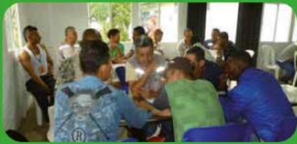
Capacitación sobre el plan de manejo ambiental.

En el plan de gestión ambientales continuamos la capacitación con el personal administrativo y de obra en temas importantes sobre el Plan de Manejo Ambiental. En este periodo se capacitaron más de 130 personas.