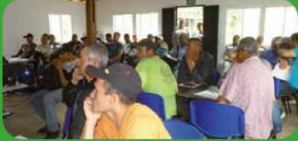
Capacitación en el manejo de residuos.