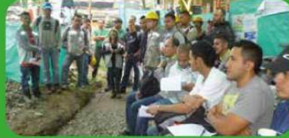
El personal de obra en pozos 14, 15 y 16.