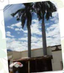
Escuela de niñas conocida como Las dos palmas