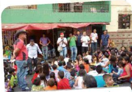
Celebración navideña con los niños