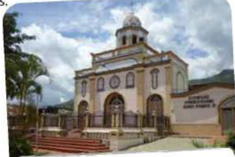
La Parroquia y el colegio Juan Pablo II