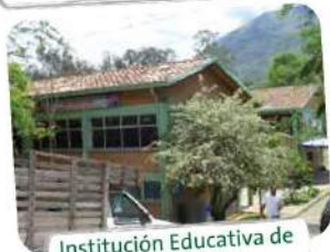
Institución Educativa de Fontidueño