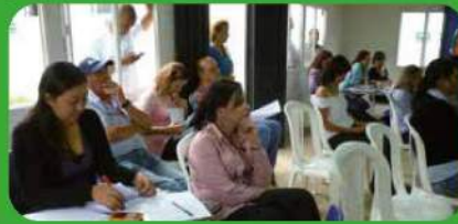
Capacitación al personal administrativo.