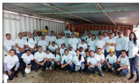
Concurso (0) accidentes - Túnel interceptor norte Ganadores segunda versión - Mayo 2014

También se cuenta con el compromiso de cada uno de los trabajadores quienes han encontrado un proyecto donde se puede laborar de forma segura garantizando su bienestar. Este compromiso ha sido la respuesta al respaldo decidido del Consorcio CICE en el tema de prevención.