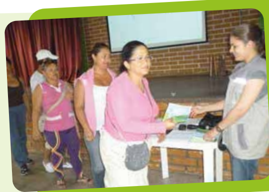
Comunidad de El Playón, La Frontera y Acevedo.

Estas memorias forman parte del reconocimiento a la participación e interés de las comunidades en las actividades de educación ambiental que hemos desarrollado desde febrero del año 2012. Sea esta la oportunidad para motivarlos a continuar asistiendo a las diferentes actividades de información, sensibilización y capacitación durante la construcción del Túnel Interceptor Norte, actitud que redundará en el fortalecimiento de la cultura ambiental de las comunidades y todos los grupos de interés que tienen relación con el Interceptor Norte.