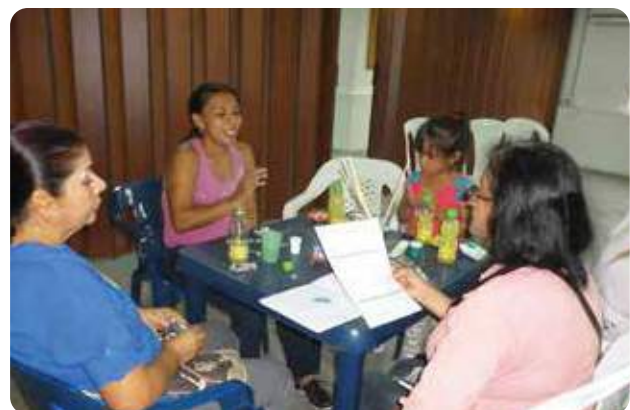
Comunidad de La Herradura y Puerto Nuevo en taller de Reciclaje.

“Esto es fenomenal, para nosotros ha sido un fortalecimiento tanto para mí como para el grupo de veedores. Por las capacitaciones que hemos tenido por medio de Aguas Nacionales y CICE nosotros pudimos salir adelante en nuestros proyectos, en nuestras actividades diarias como Grupo Veedor. Debido a las capacitaciones hemos sacado proyectos que creíamos que no éramos capaces, y salimos adelante favorecidos para un proyecto por la Alcaldía de Medellín.