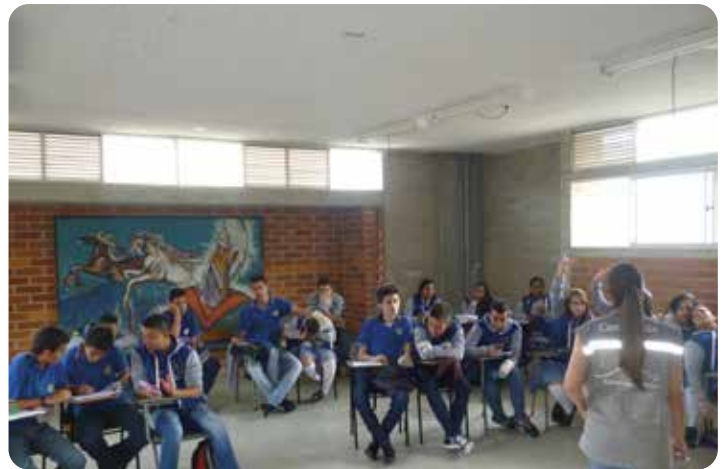
Estudiantes de la Institución Educativa La Gabriela se capacitan sobre el cambio climático

Esperamos seguir con este proyecto que está muy bonito, con miras a engrandecer esta parte norte de Bello, con ganas de que este río Medellín vuelva a nacer o resucitar porque está bien, pero tenemos que cuidarlo mucho mejor, y a ustedes del Consorcio CICE y EPM muchas gracias por esas capacitaciones, por tenernos en cuenta, por esas buenas salidas planeadas, y con esta evaluación muy contento”.