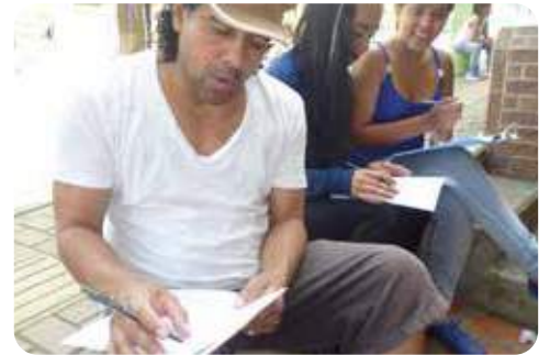
Líderes y estudiantes de La Gabriela.