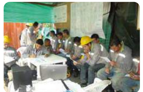
Personal de obra.

Las personas interesadas en posibles contrataciones, enviar su hoja de vida a: