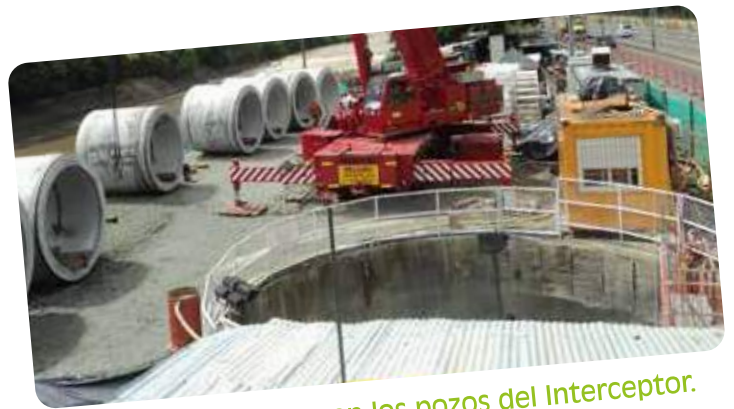
Perfil de acabados en los pozos del Interceptor.