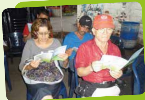
Comunidad de Andalucía, Villa Niza y barrios de Santa Cruz.

En el marco del Programa de Educación Ambiental, como parte del Plan de gestión social del proyecto, hemos elaborado una cartilla con las memorias de los temas desarrollados y actividades realizadas, con el propósito de dejarle a las organizaciones sociales, instituciones educativas y comunidades participantes en las jornadas de sensibilización y capacitación. Es un material educativo para contribuir a la sensibilización y al conocimiento sobre el medio ambiente y el programa de saneamiento del río Medellín.