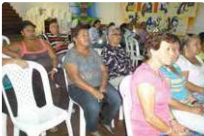
Comunidades de Acevedo, Andalucía y El Playón.

Durante el primer semestre realizamos las reuniones informativas sobre el avance de la obra. Dichas reuniones se realizaron con los habitantes, líderes, organizaciones sociales y entidades ubicadas en los barrios de influencia de Medellín y Bello. Se han realizado 5 reuniones informativas con la presencia de líderes, habitantes, organizaciones sociales, cooperativas, Juntas de Acción comunal, docentes, estudiantes y las empresas presentes en la zona donde se construye el Interceptor. Allí estuvieron representadas comunidades de Fontidueño y Los ciruelos en Bello; y de Medellín, Acevedo, Andalucía, El Playón, La Frontera, Andalucía, Villa Niza, Puerto Nuevo, La herradura, Palermo y La Paralela.