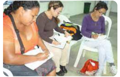
Comunidad de La Herradura, Puerto Nuevo y Parlermo