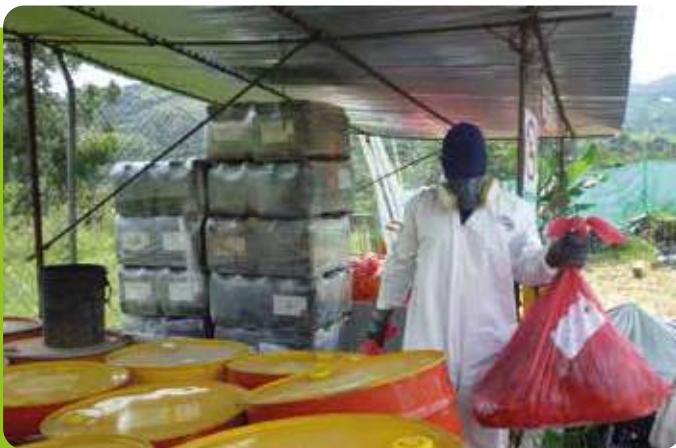
Procedemos de acuerdo a las normas con el manejo de los residuos

Igualmente se ha cumplido con el monitoreo permanente de ruido, agua y aire, según lo dispone la licencia ambiental para proteger el entorno de la obra, concluyendo que hasta el momento no se han transgredido los niveles autorizados en cada aspecto.