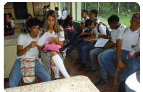
Líderes y estudiantes del barrio Fontidueño