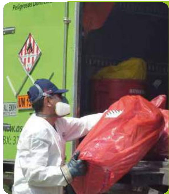
Manejo integral de Residuos peligrosos.