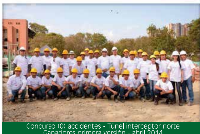
Concurso (0) accidentes - Túnel interceptor norte Ganadores primera versión - abril 2014

Todo ello se debe al equipo de trabajo profesional, serio y comprometido conformado por más de 7 profesionales, con un plan de acción enfocado a garantizar sanas condiciones de trabajo.