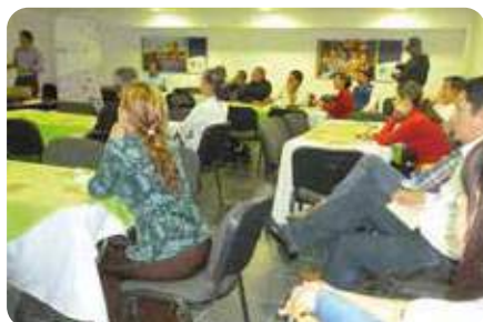
Empresas y entidades reciben información sobre la obra