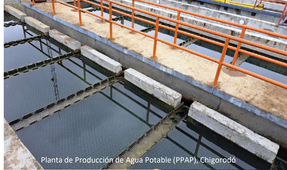
Planta de Producción de Agua Potable (PPAP), Chigorodó