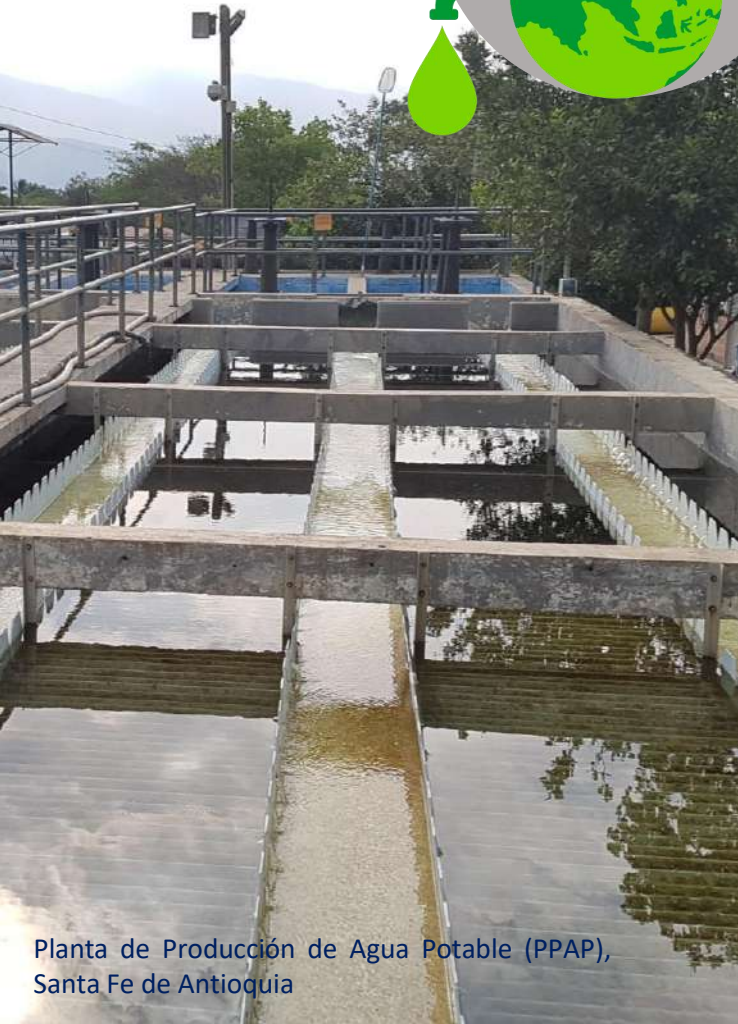
Planta de Producción de Agua Potable (PPAP), Santa Fe de Antioquia