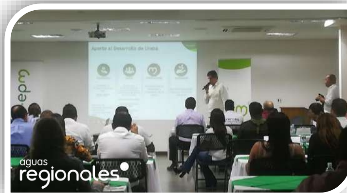
Ponencia grandes Proyectos de Región Grupo EPM.

Una vez culminado el encuentro, los Vicepresidentes realizaron un recorrido por algunas de las infraestructuras de acueducto y alcantarillado que opera Aguas Regionales; también visitaron la sede operativa en Turbo, constatando el estado actual del proceso de potabilización y saneamiento básico asumido por Aguas Regionales.