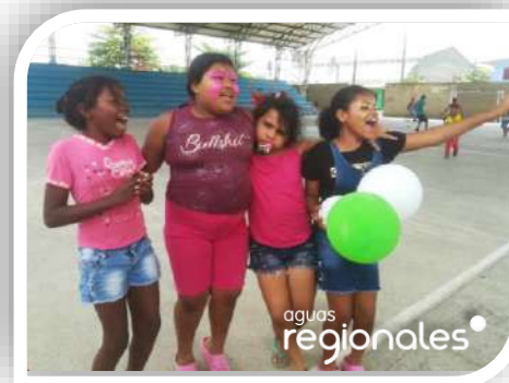
Jornada Barrial barrio el Prado, Chigorodó.

Las reuniones con los Alcaldes de los Municipios de Chigorodó, Mutatá y Bajirá han sido también un importante escenario de participación ciudadana durante este mes de marzo.