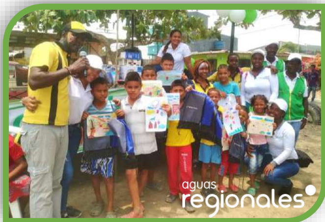
Jornada Barrial barrio el Prado, Chigorodó.

¡Una apuesta por la cercanía, la calidez y la responsabilidad empresarial de Aguas Regionales y el Grupo EPM!