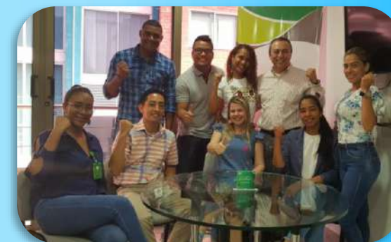
1er Café con el Gerente – Urabá.