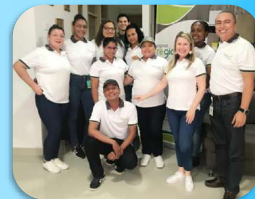
Espacio de cercanía, Área de Gestión Administrativa – Urabá.