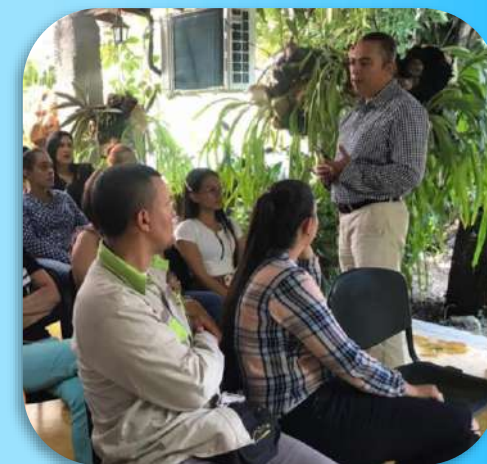
Espacio de cercanía con todo el personal, Sede administrativa – Occidente.