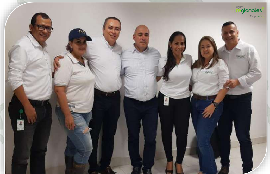
Encuentro con la Administración del municipio de Carepa

A la fecha ya nos hemos reunido con las Alcaldías de: Turbo, Apartadó, Carepa, Chigorodó, Santa Fe de Antioquia, Sopetrán, San Jerónimo y Olaya; con el objetivo de dar un contexto general sobre los servicios que prestamos en el territorio, presentar las principales inversiones que se han realizado, así como un balance de los logros, retos y desafíos.