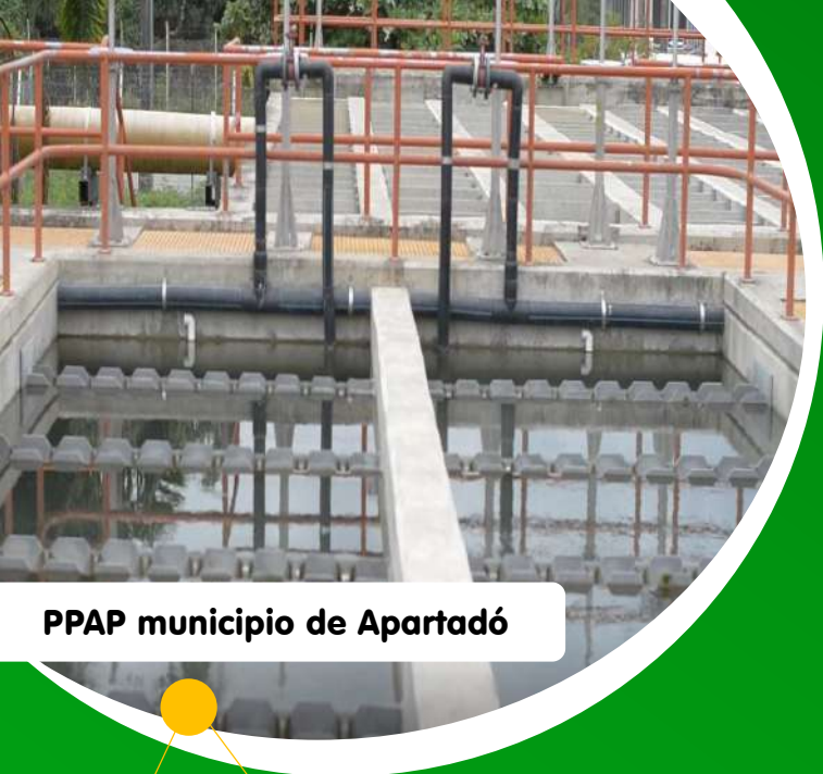
PPAP municipio de Apartadó