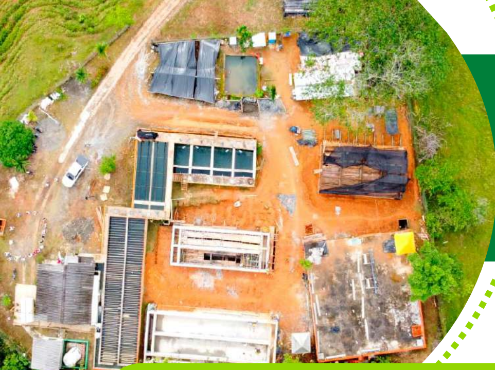
Foto aérea del proceso constructivo de la ampliación de la PPAP