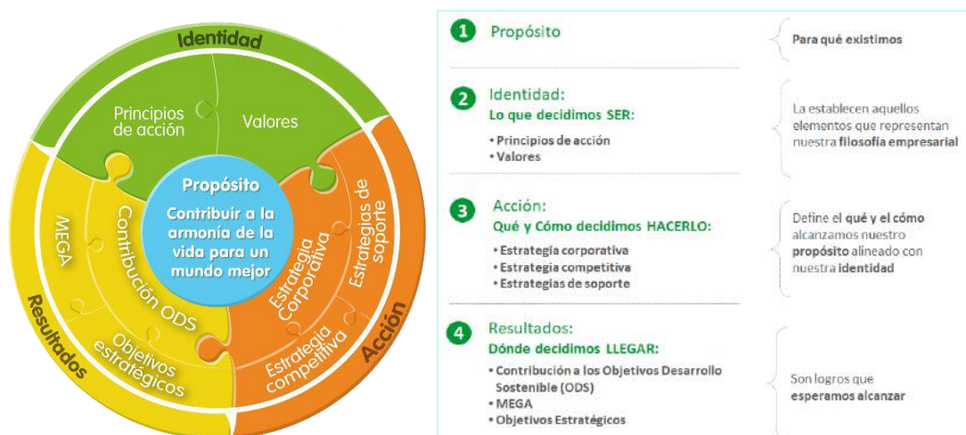
Gráfico No. 2 Componentes y alcance de la dimensión estrategia.

En el siguiente esquema se describe cada uno de los cuatro componentes y su alcance: