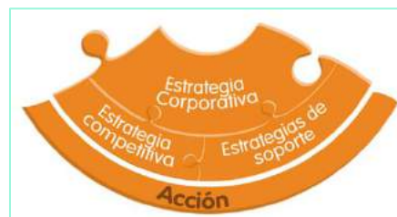
Gráfico No. 3 Detalle del componente de acción

La estrategia corporativa se encarga de orientar al Grupo empresarial en su visión de largo plazo, la estrategia competitiva focaliza la acción de los negocios en el mercado desarrollando propuestas de valor y modelos de negocio consistentes con las necesidades de sus clientes y usuarios, y la estrategia funcional apoyando a los negocios, brindando servicios de alto valor representados en dotar a los productos y servicios que éstos ofrecen, de eficiencia y diferenciación.