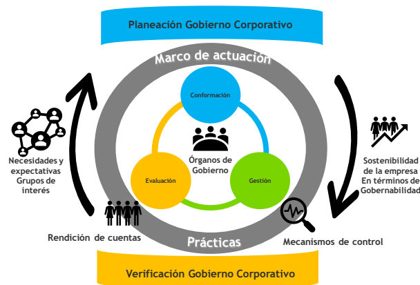
Gráfico de la Representación del “Marco General del Gobierno Corporativo”. Elaboración propia Grupo EPM

Este modelo se fundamenta en los órganos de gobierno, la definición de su marco de actuación mediante prácticas de gobierno, los mecanismos de control, y la rendición de cuentas.