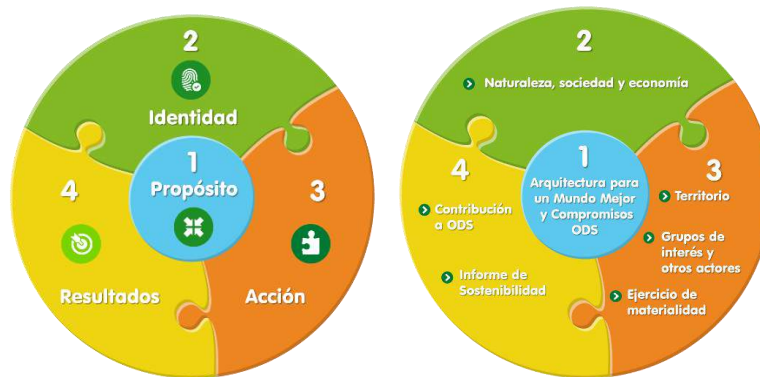
Gráfico No.1 Articulación de la dimensión de estrategia con el modelo de sostenibilidad

En el siguiente esquema se describe cada uno de los cuatro componentes y su alcance: