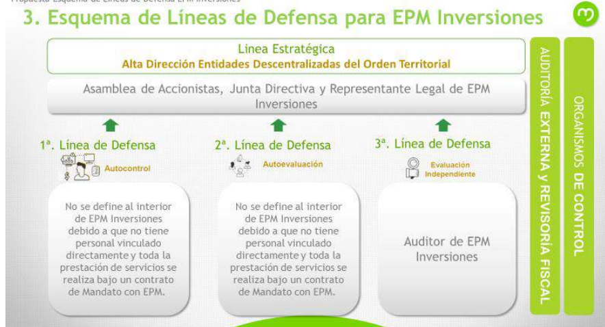
Propuesta Esquema de Líneas de Defensa EPM Inversiones

FURAG: el DAFP, por medio de correo electrónico enviado el 12 de junio de 2020, indicó que la aplicabilidad del FURAG no superaba el 20% para EPM Inversiones, razón por la cual fue excluida del reporte.