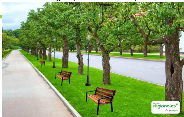
Imagen proyectada del sendero peatonal barrio El Darién, Apartadó.

En este sentido, se hará una tala de 26 árboles en el sector, y una compensación de 104 árboles, de los cuales 84 se sembrarán en el sendero y los restantes en los lugares que disponga la Corporación Ambiental.