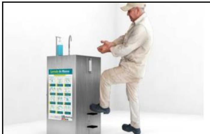
Imagen de referencia en la siguiente página

Sin embargo, aunque el anclaje se requiere a pared y a piso, su estructura también deberá soportar aquellos puntos donde únicamente irán anclados al piso, si así se requiere; sin generar afectaciones en su estabilidad.